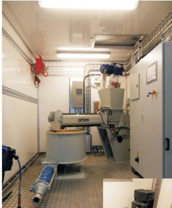
Blandningsrum med blandare, pump, vattenpump. Styrskåp touchpanel och inbyggt printerskåp. Blandare utrustad med vattenautomatik och flödesmätare. Frekvensstyrd pump med 200 liters kar med omrörare och nivågivare för automatisk drift.