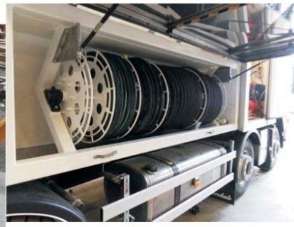
Slangvinda med plats för 4 pumpslangar a 40 m, 120 m Vattenslang och Elkabel, Manövreras med fotpedal.

Konstruktion - Tillverking - Försäljning - Service