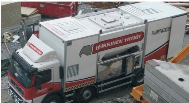
Silotaket med avtagbar bur med dammtätning för storsäckstömmning och lucka för fabriksfyllning. Säkerhetsventil och nivåvakt. Utrustad med fällbara räcke på båda sidor.