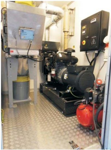
Maskinhus innehållande generator, damm filter, fläkt och kompressor etc.