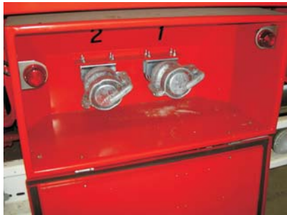
Anslutning för påfyllning från bulk med lampindikering för full silo