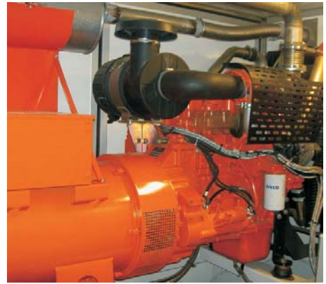
Maskinhuset med Generator, Slangvinda, Dammfilter och Kompressor