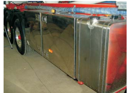
Rostfria förvaringsskåp och diesel tank för generator.