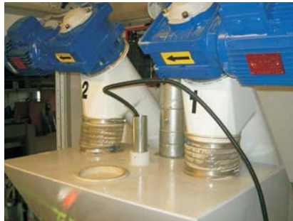
Doseringskruvar från Silo styrs automatiskt via nivåvakter