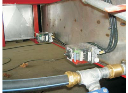
I vattentanken finns Elpartoner 2x9 kW, Nivågivare samt Flottörventil