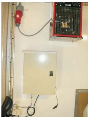
Printerskåp samt värmefläkt