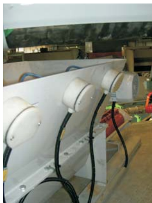
Nivågivare i pumpkar